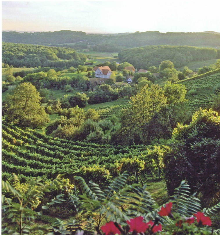
Romantische Stimmung in den Weinbergen um Straden. Hier wachsen ausgezeichnete Pinots wie zum Beispiel der Grauburgunder vom Weingut Neumeister.