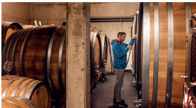
Weingüter im Vulkanland