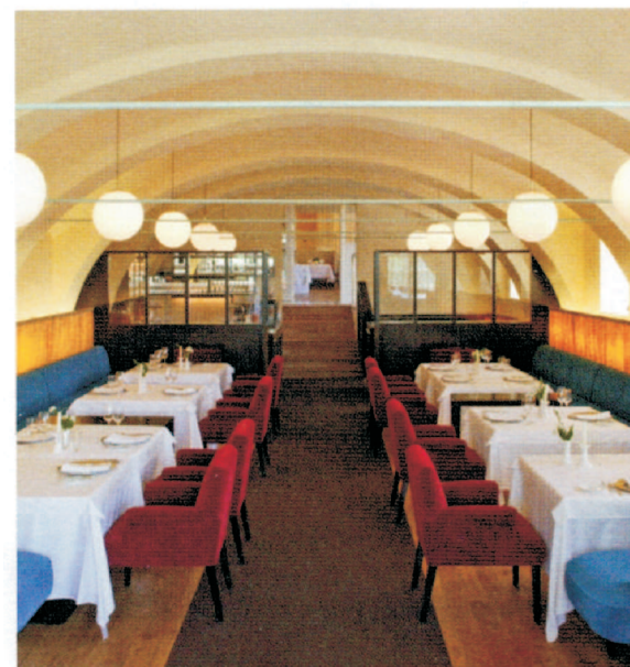
Kochkunst auf hohem Niveau in der »Saziani Stub'n«